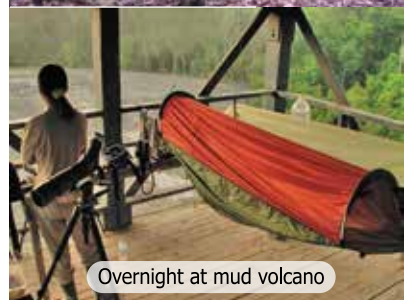
Overnight at mud volcano