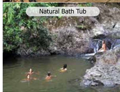
Natural Bath Tub